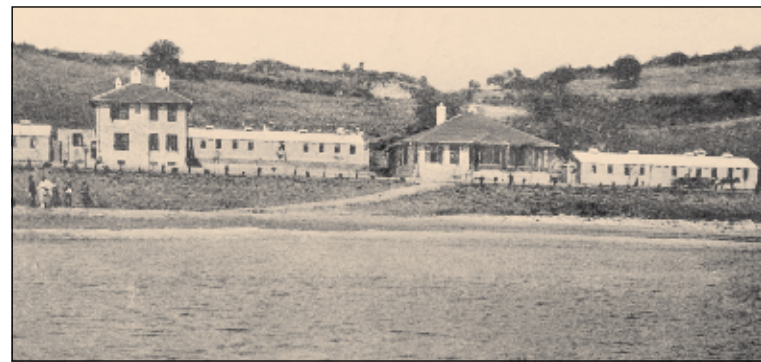
Морски санаториуми в местността „Св. Константин“, 1910-1911 г.

През 1908 г. Географското и Археологическото дружество във Варна заедно с общината в с. Кестрич създават Манастирско настоятелство на Аладжа манастир за преименуването и освещаването му като манастир „Св. Троица“ с цел да направят един храм патронен празник – събор, на който да се събират християните от селата и градовете от целия регион. На 31 май 1908 г. Църковното настоятелство на манастира „Св. Троица“, изпълнявайки намеренията си, тръгват с