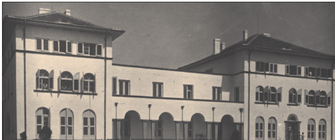
Почивната станция на телеграфо-пощенските служители в местността „Св. Константин“, 1910-1911 г.

Кастрици, нанесено и на някои средновековни карти. Този факт се подкрепя и от археологическите разкопки, проведени в крепостта през последните години – открити са множество артефакти, като медни и керамични съдове, различни украшения, повечето от тях – вносни. Открити са също и множество бронзови, сребърни и златни, единични и колективни находки на средновековни български, византийски и османски монети, венециански грошове и много други монети от