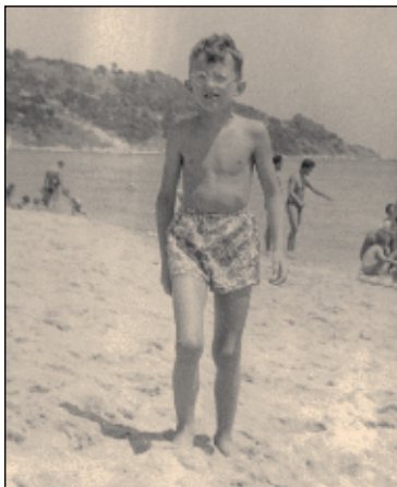
На плажа на „Св. Константин“, 1961 г.

или зелен фасул яхния, а за вечеря – основно ястие и десерт. Обикновено десертът беше някакъв крем от нишесте с плодови сироп, макарони на фурна или кисело мляко със захар.